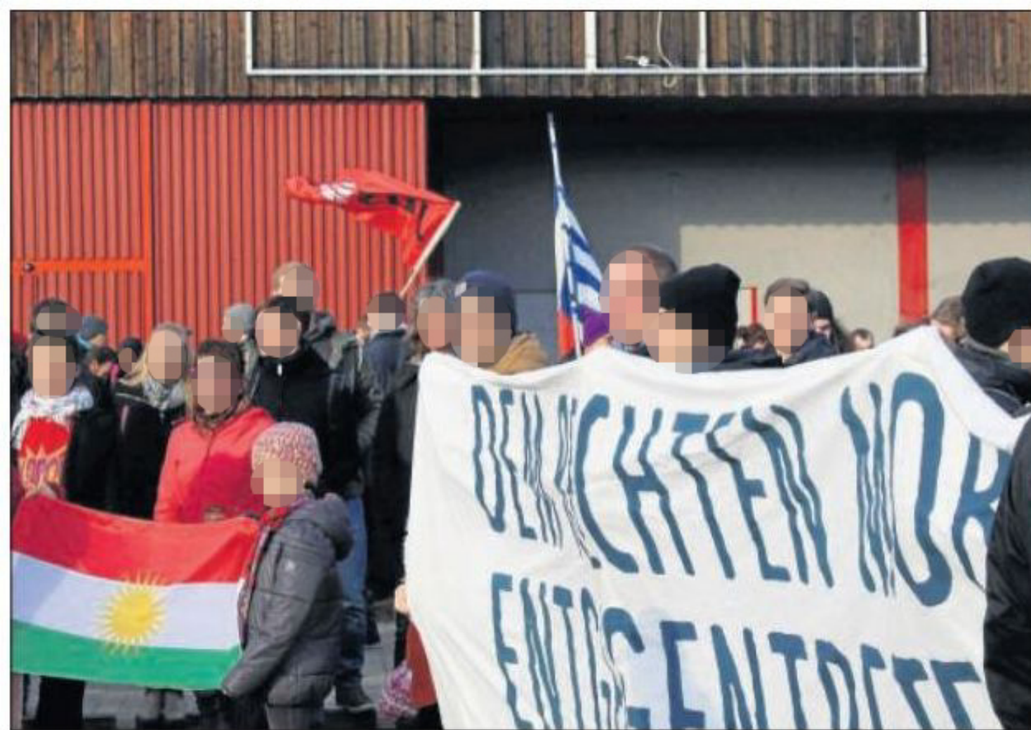
Vor dem ehemaligen Bevenser Intermarché, in dem mutmaßlich Feuer gelegt wurde, demonstrieren am Sonnabend mehrere hundert Menschen.